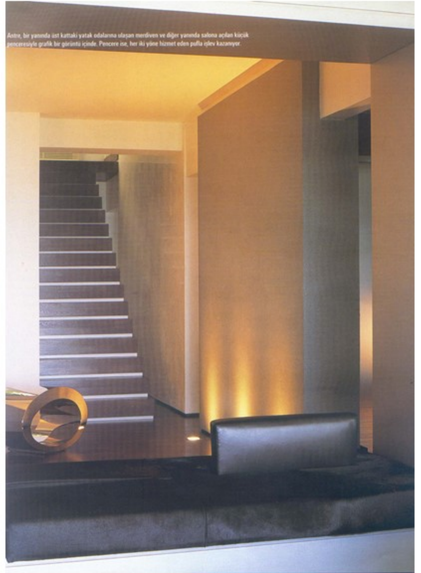
Astra, bir yanında üst kattaki yatak odasına ulaşan merdiven ve diğer yanında salona açılan küçük pencereyle grafik bir girişte içinde. Pencere ise, her iki yane hizmet eden pufu çözüyor.