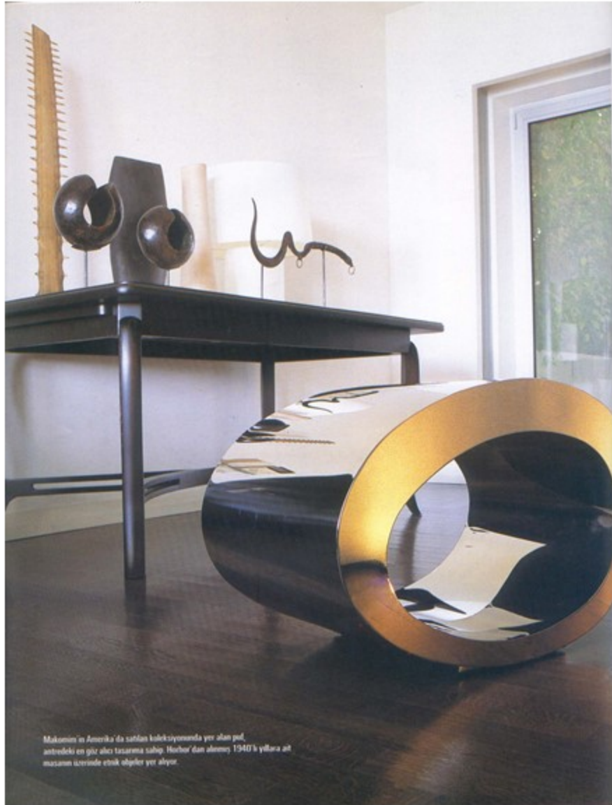
Makomim'in Amerika'da satışları koleksiyonunda yer alan pul, antredeki en göz alıcı tasarıma sahip. Herhar'dan alması 1940'lı yıllara ait mazaran üzerinde etnik objeler yer alıyor.